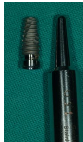
Fig. 2. Foto del implante Osseotite NT Certain (3i Implants Innovations, USA) comparado con el osteotomo de 4 mm de diámetro por 13 mm de longitud.