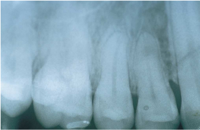
Fig. 3a. Reabsorción apical en 3a: 1.5, 1.4. Apical resorption in 3a: 1.5, 1.4.