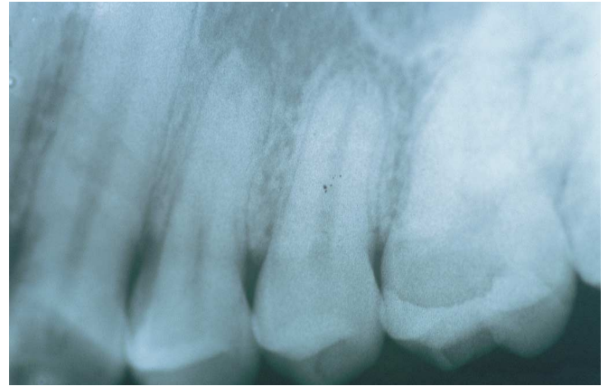
Fig. 3b. Reabsorción apical en: 3b: 2.5, 2.4. Apical resorption in: 3b: 2.5, 2.4.