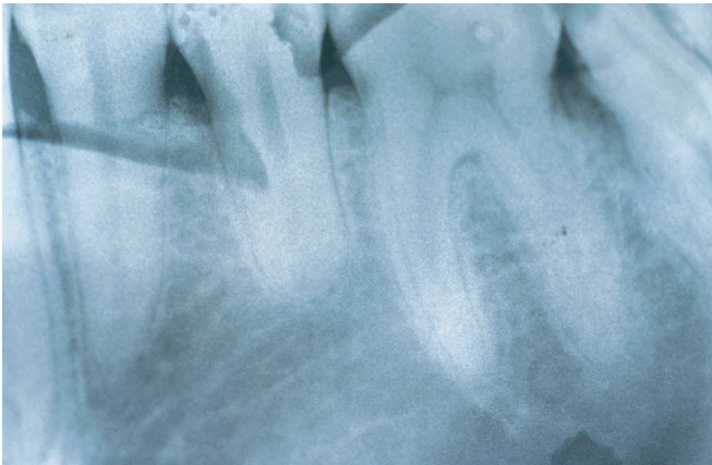
Fig. 3c. Reabsorción apical en: 3c: 3.5. Apical resorption in: 3c: 3.5.