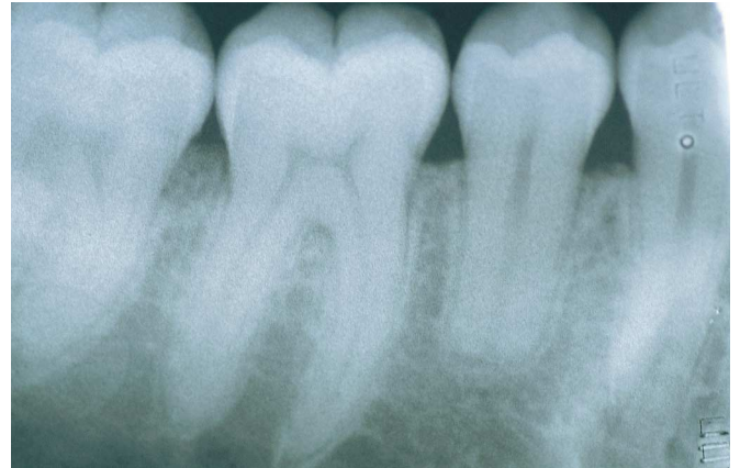
Fig. 3d. Reabsorción apical en: 3d: 4.5. Apical resorption in: 3d: 4.5.

do se desarrolla en la edad adulta produce osteomalacia; todas estas situaciones fueron descartadas en nuestros pacientes. La forma adquirida tiene como causas más habituales la nefropatía diabética y la nefrosclerosis por hipertensión, factores también descartados en nuestros pacientes (38, 39).